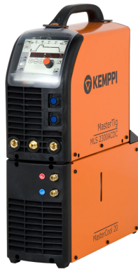
MasterTig MLS 2300ACDC

MasterTig 2300ACDC ist eine 230-A-Version mit 1-phasiger 230-V-Stromversorgung. Diese Schweißmaschine ermöglicht allen WIG-Schweißprofis die Kontrolle, die sie für ihre Aufgaben benötigen.