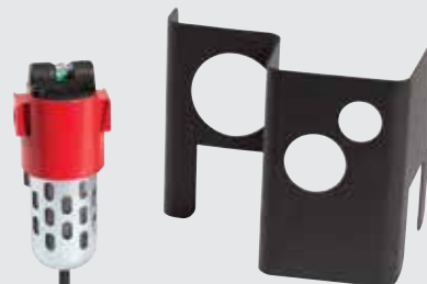
Eliminer-Filter und -Abdeckung